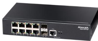
図 1 AXprimoM210-08T

ALAXALA コンパクト・ギガビットレイヤ 2 スイッチ AXprimoM210 シリーズは、以下の 2 モデルがあります。AXprimoM210 シリーズの外観写真を「図 1」～「図 2」に示します。