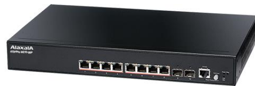
図 2 AXprimoM210-08P