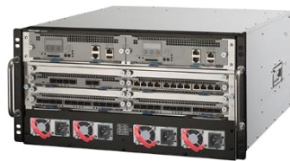
AX8304S (AC/DC 筐体共通)

ALAXALA 次世代ミッドレンジスイッチ AX8300S シリーズには、以下の 2 モデルがあります。