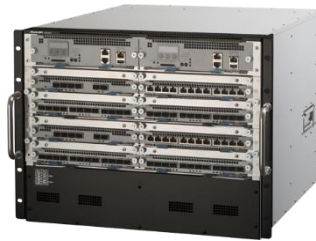
AX8308S (AC/DC 筐体共通)