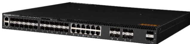
図 3 AX3660S-16S4XW, AX3660S-24S8XW