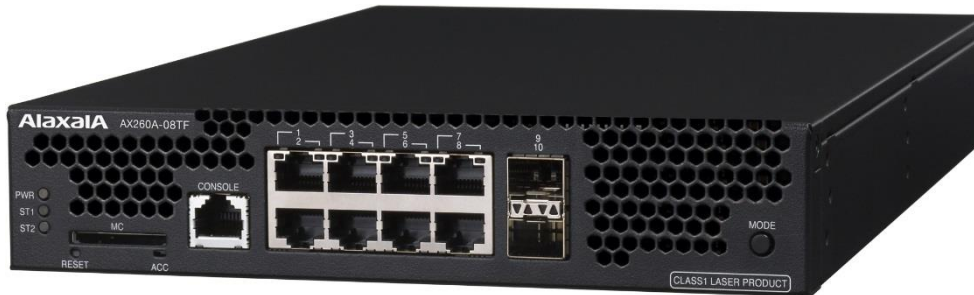
図 1 AX260A-08TF/AX260A-08T

ALAXALA 小型アプライアンス装置 AX260A シリーズは、以下の 2 モデルがあります。 AX260A シリーズの外観写真を「図 1」に示します。