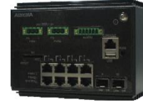
図 8 AX2530S-08TC1(DC 電源モデル)