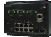
図 8 AX2530S-08TC1(DC 電源モデル)