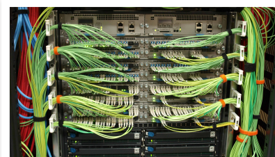
フォールト・トレラント・スイッチ AX8616S