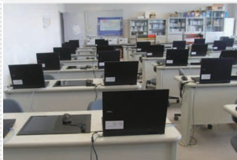
英語教育を行うLL教室、情報教育を行う情報処理室にはそれぞれクライアントPCが50台ずつ配置され、ストリーミング動画を使った講義が行われている。

宮崎県立看護大学は看護大学という特性上、臨床実習では患者の個人情報扱う機会も多く、より強固なセキュリティ対策が求められる。また、県の教育機関として、安定したサービスを提供し続けなければならない。このような使命がある中、同大学は要件を満たすインフラ環境が構築できた。同大学の事例は、ネットワークの安定化・高度化を目指す多くの企業・団体の参考になるだろう。