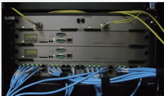
本館のコンピューター室にコアスイッチ「AX6304S」が1台、教育研究棟にもコアスイッチ「AX6304S」が配置され、10GBネットワークで接続されている。