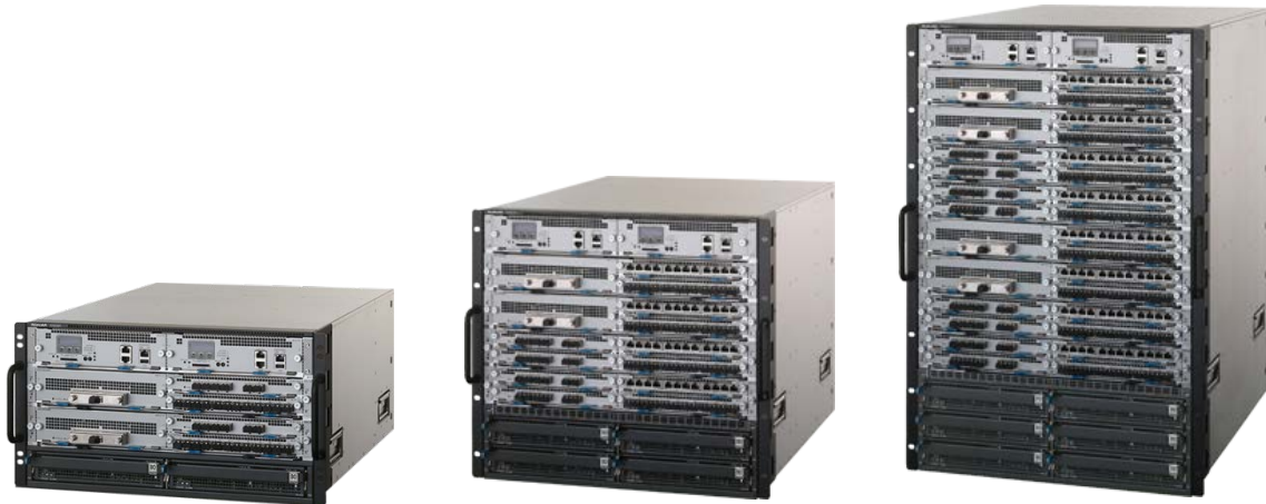
AX8608S (AC/DC 筐体共通)

ALAXALA 次世代テラビットスイッチ AX8600S シリーズには、以下の 3 モデルがあります。