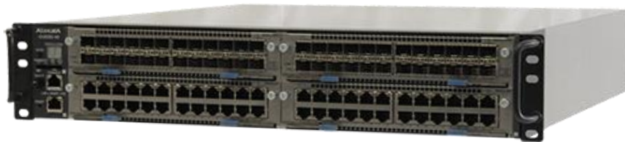
図 1 AX4630S-4M (AC/DC 筐体共通)