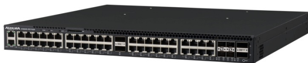
図 3 AX3660S-48XT4QW