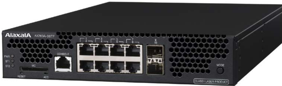
図 1 AX260A-08TF/AX260A-08T

ALAXALA 小型アプライアンス装置 AX260A シリーズは、以下の 2 モデルがあります。 AX260A シリーズの外観写真を「図 1」に示します。