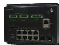
図 8 AX2530S-08TC1 (DC 電源モデル)