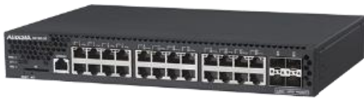
図 1 AX2130SS-24T

ALAXALA コンパクト・ギガビットレイヤ 2 スイッチ AX2100S シリーズは、以下の 2 モデルがあります。AX2100S シリーズの外観写真を「図 1」～「図 2」に示します。