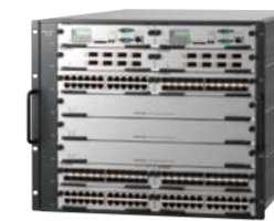
アラクサラの10ギガビットスイッチ「AX6700Sシリーズ」

TIWC Cloudbaseでは、高度なセキュリティを確保できるアラクサラネットワークスの「セキュア仮想ネットワーク」が使われている。ネットワーク・パーティションという機能によってサーバーやストレージと同様にネットワークも仮想化し、ユーザーのアクセス範囲を規定する。これによってセキュアな仮想システムを構築できる。