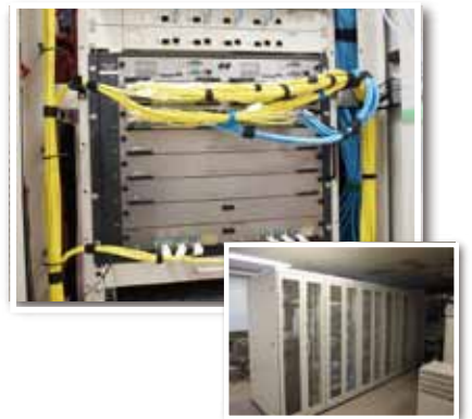
ダイナミック省電力機能を搭載した拠点コアスイッチAX6708S